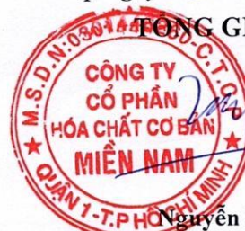
Nguyễn Hữu Thọ