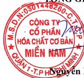
Nguyễn Hữu Thọ