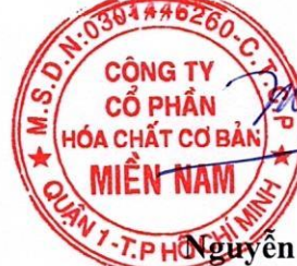
Nguyễn Hữu Thọ