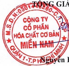
Nguyễn Hữu Thọ